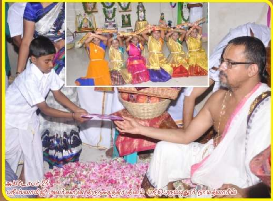
அக்டோபர் 24 ஸ்ரீஸ்வரயஜி அவர்களின் (திருநகைத்திர தினம்) ஸ்ரீபெரும்புதூர் நாமதவாரில்