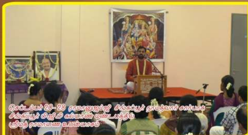
டிசம்பர் 20-28 ராமானுஜம்ஜி சிங்கப்பூர் நாமத்வாரி சார்பாக சிங்கப்பூர் விஜிவி கல்யாண மண்டபத்தில் ஸ்ரீமத் ராமாயண உபந்யாசம்