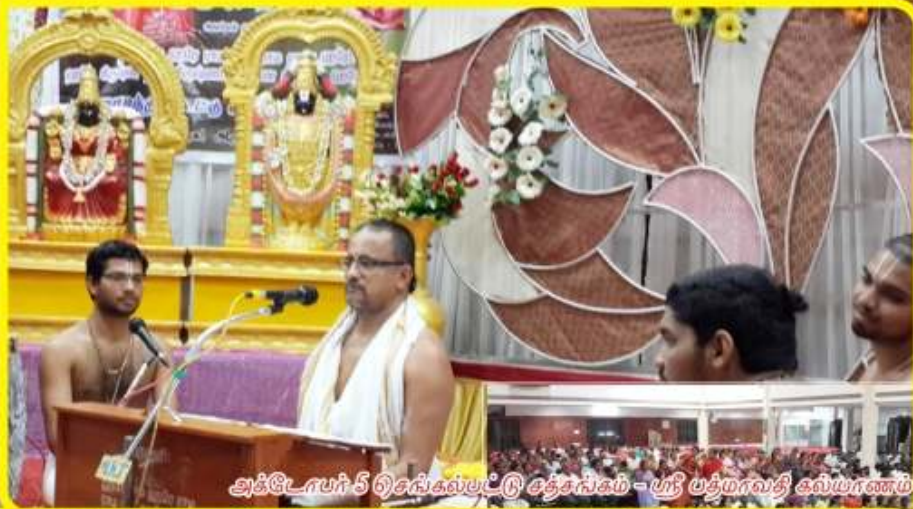
அக்டோபர் 5 தென்செல்பட்டு சத்தாசகம் - ஸ்ரீ பத்மாவதி கல்யாணம்