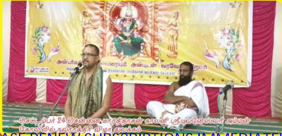
தெய்வம்பர் 24 தென்னை பாரதிதாசன் காவலி ஸ்ரீபுவனேஸ்வரி அம்மன் கோவிலில் நவராத்திரி விழா துவக்கம்