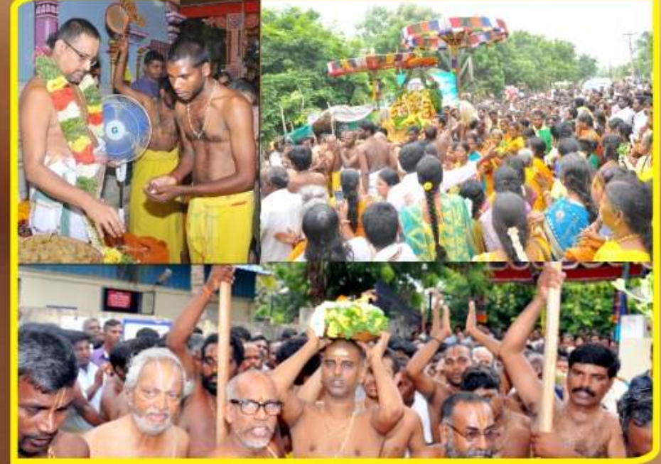
அக்டோபர் 11 புரட்டாசி னைட்சி சனிக்கிழமை ஸ்ரீகல்யாண ஸ்ரீநிவாச பெருமான் கோவிலில் அன்னசுடோத்ஸவம்