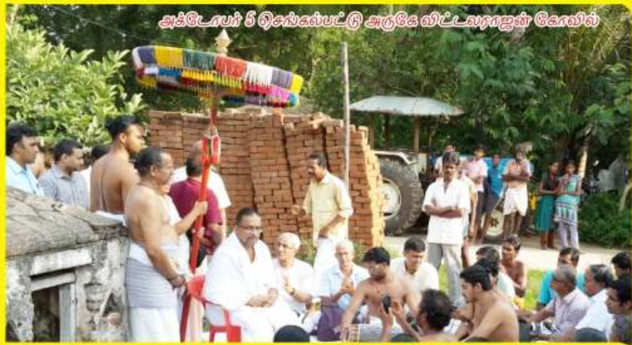
அக்டோபர் 5 தென்செல்பட்டு அருகே விட்டவராஜன் கோவில்