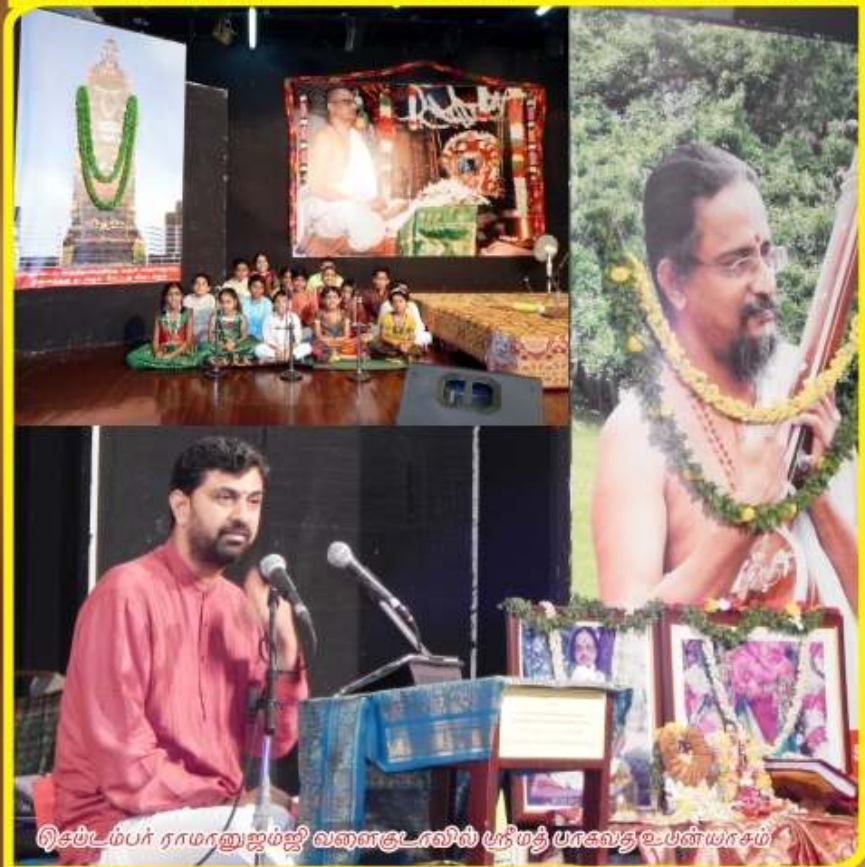
டிசம்பர் ராமானுஜம்ஜி வளைகுடாவில் ஸ்ரீமத் பாகவத உபந்யாசம்