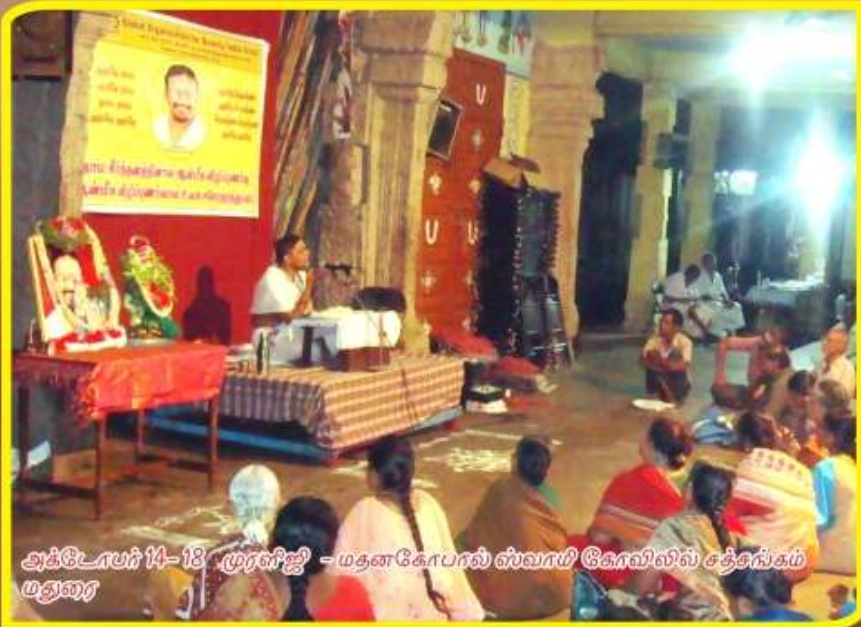
அக்டோபர் 14-18 முரளிஜி - மதனகோபால் ஸ்வாமி கோவிலில் சத்திரங்கம் மதுரை