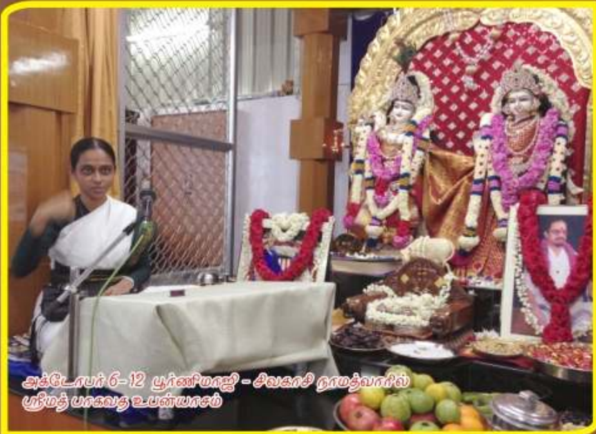
அக்டோபர் 6-12 பூர்ணிமாஜி - சிவகாசி நாமத்வாரில் ஸ்ரீமத் பாகவத உபந்யாசம்